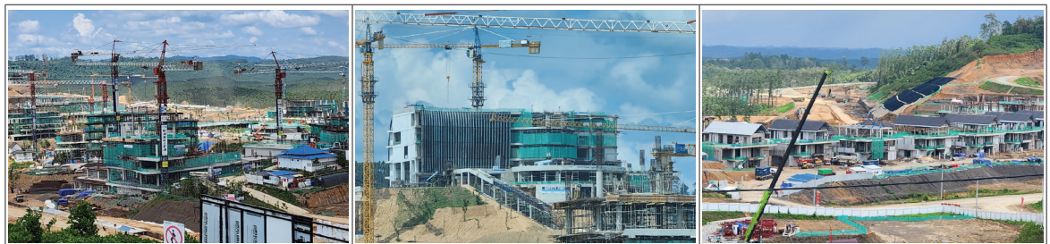
그림 3 인도네시아 수도이전 추진 현황