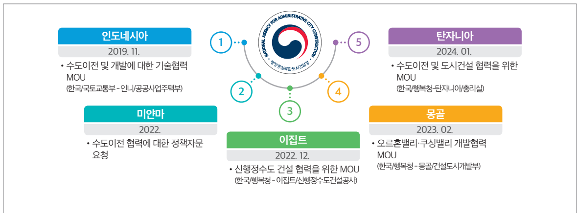
그림 1 수도이전 경험에 대한 지식교류 요청 및 약정 체결 현황